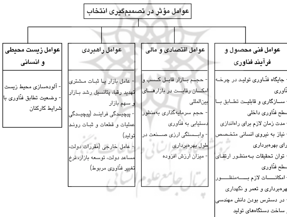
شکل 2 عوامل مؤثر در تصمیم‌گیری انتخاب

با توجه به اهداف و راهبرد کلان صنعت پارافین، می‌توان عوامل مؤثر بر این ابعاد را در شکل 2 به عوامل جزئی‌تر تقسیم کرد. با شناسایی این عوامل می‌توان آثار انتخاب هر گزینه را مورد تجزیه و تحلیل قرار داده، تحت مدلی به اتخاذ تصمیم پرداخت.