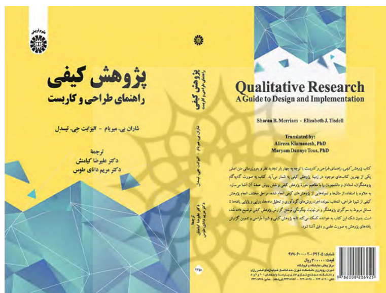
شکل ۱. تصویر جلد کتاب پژوهش کیفی

یکی از آثار بدیع و مناسب که به دانشجویان تحصیلات تکمیلی برای آموزش پژوهش کیفی بسیار مفید است، کتاب پژوهش کیفی: راهنمای طراحی و کاربست ، تألیف شارن بی میریام و الیزابت جی تیسدل است که نسخه آخر (چهارم) آن در سال ۲۰۱۶ چاپ شد و علیرضا کیامنش و مریم دانای طوس آن را ترجمه کردند که در