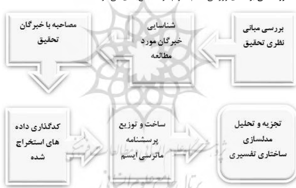
شکل ۱- سطح‌بندی و مراحل انجام تحقیق

خطرات احتمالی زیست‌محیطی را با خود به همراه دارند. با توجه به ادبیات تحقیق می‌توان گفت، ویژگی‌های محیطی تأثیرات بسیار زیادی بر جذب مشتری دارد و در مقابل آن وجود برندهای به‌روز و معروف تأثیر آن را نیز دوچندان می‌کند. در واقع، برندهای باکیفیت عاملی می‌شود که مشتریان تقاضای بیشتری داشته باشند درباره محصولات و فروشگاه‌هایی که از آن خرید می‌کنند. با جست‌وجوی اطلاعات از قبل و به کار گرفتن آن که مشتریان به دنبال چه محصولاتی هستند، می‌توانیم درباره برندهای موجود آگاهی کسب کنیم؛ بنابراین باعث شناسایی آنچه مشتریان از ما و فروشگاه ما می‌خواهند می‌شود که در نتیجه جذابیت محیط فروشگاه ما باعث جذب بیشتر مشتریان برندهای ورزشی می‌شود. همچنین می‌توان گفت، در دهه‌های گذشته به دلیل وجود بعضی از مشکلات، کم بودن امکانات و... بیشتر فروشگاه‌های ورزشی ارزشی برای محیط کسب‌وکار خود قائل نمی‌شدند؛ از این رو با سردرگمی روبه‌رو بودند. به‌منظور کاهش این سردرگمی، ابتدا باید تمام منابع مؤثر بر سردرگمی را شناسایی نمود و سپس تلاش کرد این منابع کاهش یابند. با توجه به پیشینه پژوهش و نظر به اهمیت جذابیت محیط فروشگاه بر مدیریت برند و ایجاد تصویر مطلوب برند در ذهن مشتریان و در نهایت به عنوان ابزاری برای ایجاد مزیت رقابتی و همچنین به‌منظور توسعه یافته‌ها در این زمینه، این پژوهش به دنبال پاسخ به این سؤال است که عوامل مؤثر بر ارتقای جذابیت محیط فروشگاه‌های ورزشی کدام‌اند و چگونه سطح‌بندی می‌شوند؟