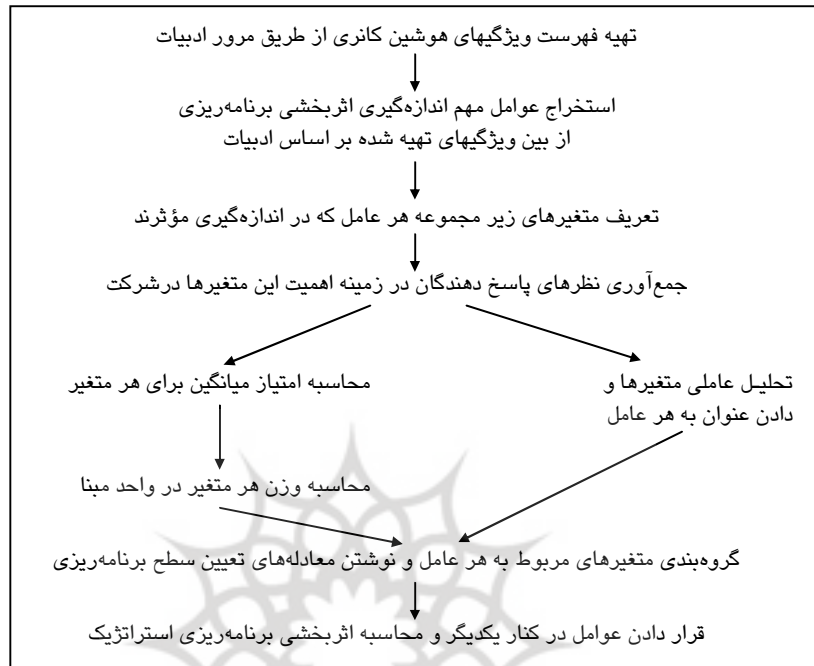
نمودار ۱ رویه نظام‌مند محاسبه اثربخشی برنامه‌ریزی استراتژی

به منظور محاسبه برای سطح برنامه‌ریزی استراتژیک، محاسبه امتیاز میانگین ۱ هر یک، از متغیرها و همچنین هر یک از عوامل استخراج شده، ضروری است. از آنجا که مبنای مقایسه نظام برنامه‌ریزی هوشین کانری است، در نتیجه وزن کلیه متغیرها در معادلات تعیین سطح برنامه‌ریزی، برابر و مساوی با یک در نظر گرفته شد. چنانچه اندازه‌گیری در بیش از یک شرکت یا واحد کسب و کار تجاری مستقل از هم انجام شود، در آن صورت، یکی از آن واحدها که دارای «بهترین عملکرد» است، می‌تواند به عنوان پایه و مبنای مقایسه قرار گیرد و وزن متغیرها برای محاسبه معادلات تعیین سطح برنامه‌ریزی استفاده شود. در آن صورت، وزن هر متغیر در شرکت یا واحد مبنا چنین محاسبه می‌شود.