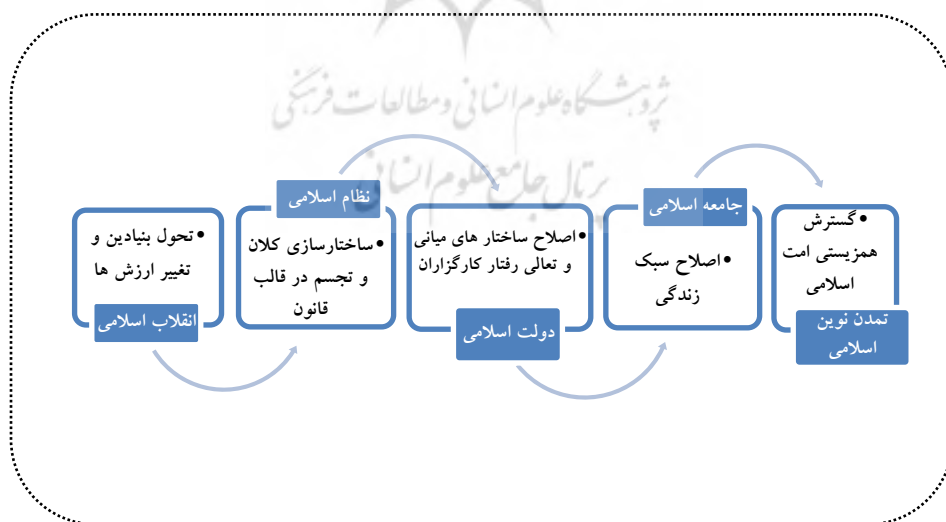
شکل ۱. مراحل صیوررت تمدن نوین اسلامی از منظر رهبر معظم انقلاب اسلامی

عقلانیت (وبر، ۱۳۸۴)، برخی تمدن را مترادف با کنترل نفس و سرکوب غرایز دانسته‌اند (فروید، ۱۳۸۲، الیاس، ۲۰۰۰، مارکوزه، ۱۳۸۲)، در مقابل برخی سلطه و طبیعت و روابط انسانی و به عبارتی رشد اقتصادی و اجتماعی را به تمدن نسبت داده‌اند (مارکس، ۱۳۸۸). «برخی ویژگی‌های تمدن عبارت‌اند از: خاستگاه عقلانی، نظام‌های اجتماعی، این جهانی بودن، هماهنگی و همسویی، هویت و پویایی تمدن» (میر محمدی و بارانی، ۱۳۹۱، ص ۷). با بررسی تعاریف مختلف از تمدن در مجموع می‌توان گفت «تحقق یک تمدن مستلزم وجود عقلانیتی است که مبانی فکری برای نظام سازی در یک منطقه جغرافیایی را تأمین نماید تا با یکپارچگی، پویایی، عینیت و بسط تاریخی آن نظام‌های اجتماعی و همچنین با تولید، اشاعه و تعمیق معانی در بعد مردمی، هویت تمدن به معنای کامل خود فرصت بروز و ظهور پیدا کند» (بشیر، ۱۴۰۰، ص ۴). «مؤلفه‌های مفهومی عقلانیت و مبانی فکری، نظام‌های اجتماعی، یکپارچگی، عینیت و پویایی آن‌ها، بسط تاریخی و جغرافیایی و هویت و تصویر معنایی تمدن، تصویر نسبتاً کاملی از تمدن بر اساس مبانی بومی ارائه می‌دهند» (امامی، ۱۳۹۶، ص ۱۳۷). بنابراین در نگاهی کلی تر ۴ مفهوم «مبانی»، «پویایی»، «انسجام» و «معنا» می‌توانند به‌عنوان ۴ مؤلفه که تصویر روشنی از ابعاد تمدنی پدیده‌ها ارائه می‌دهند به حساب آیند. این تصویر مطابق با تصویری است که حضرت آیت‌الله خامنه‌ای برای تمدن نوین اسلامی مطرح می‌کنند: