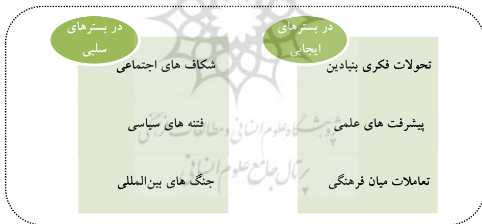
نمودار شماره ۱. مقاومت و پیشرفت تمدنی

علمی و تعاملات میان فرهنگی می‌تواند محصول مقاومت در نگاهی ایجابی باشد. همچنان که غلبه بر شکاف‌های اجتماعی، فتنه‌های سیاسی و جنگ‌های بین‌المللی حاصل مقاومت در نگاه سلبی آن است. انکشاف حقیقت از مسیر مقاومت یا در تحولات بنیادین فکری حاصل از مقاومت فکری متفکران جامعه در ساحت روح تمدن، یا در رشد و افزایش علم و آگاهی حاصل از مقاومت علمی جامعه علمی و همچنین افزایش تعاملات میان فرهنگی حاصل از مقاومت فرهنگی مردم در ساحت عقل و یا در سختی و اضطراب‌های ناشی از شکاف‌های اجتماعی، فتنه‌های سیاسی و تقابل‌های نظامی حاصل از مقاومت سیاسی و نظامی مردم و نظامیان جامعه در ساحت غریزه، منکشف می‌شود و زمینه پیشرفت تمدنی را فراهم می‌سازد (نمودار شماره ۵). تجربه جمهوری اسلامی ایران نشان داده است که مقاومت راه پیشرفت تمدنی است. رشد تحولات فکری، علمی و میان فرهنگی در سال‌های پس از انقلاب اسلامی ایران نشان‌دهنده مقاومت ایجابی در ساحت‌های مختلف جامعه ایرانی است. همچنین ۸ سال مقاومت در دفاع مقدس و گذر از فتنه‌های مختلف اجتماعی و سیاسی از جمله در سال ۱۳۸۸ از پیامدهای مقاومت سلبی جمهوری اسلامی ایران است.