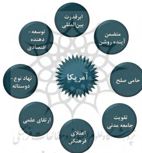
شکل ۲. مفاهیم بازنمایی شده در وبسایت‌های سازمان‌های بشردوستانه آمریکایی

همچنین تحلیل محتوای دو وبسایت متعلق به سازمان‌های بشردوستانه آمریکایی در عراق و مطالعه مفاهیم بازنمایی شده در این وبسایت‌ها، گویای این مطلب است که اساسی‌ترین مفاهیمی که سازمان‌های آمریکایی بر آن‌ها متمرکز شده و از