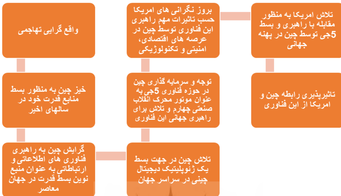
شکل ۱. نمای کلی پژوهش