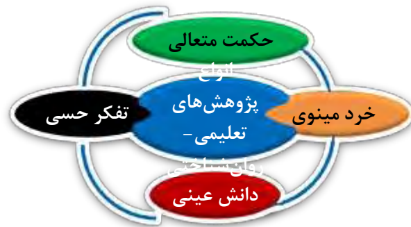
شکل ۳. (لطف‌آبادی، ۱۳۸۵: ۵۵)

تفکر حسی برپایه‌ی حواس پنج‌گانه بینایی، بساوی، چشایی، بویایی و شنیداری شکل می‌گیرد و شخص را به صورت محدودی از واقعیت‌ها آگاه می‌سازد. دانش عینی، یافته‌های تجربی نظام‌مند است که هنگام تعیین ماهیت موضوع به دست آمده‌اند. خرد نیز به دانش تعمقی برای شناسایی سره از ناسره و نیک از بد گفته می‌شود. خرد مینوی ۱ گونه‌ای از خرد است که در راه بررسی مفاهیم بنیادی همراه با بصیرت قلبی به کار می‌رود. نظریه‌پردازان بزرگ اوایل قرن بیستم، اخلاق را مهم‌ترین ابزار برای رسیدن به رشد اجتماعی برشمرده‌اند. ژان پیاژه ۲ (۱۸۹۶-۱۹۸۰) رشد اخلاقی را با مفهوم رشدشناختی ۳ (چگونگی قضاوت درباره‌ی رفتار خود و دیگران) مرتبط دانسته است. وی با دیدگاهی نسبی‌گرایانه به رشد اخلاقی، معتقد بود که فرد هنگام ورود به مرحله‌ی عملیات صوری تمامی اندیشه‌های پیشین خود را بازبینی می‌کند و در نهایت به درکی منطقی‌تر و انتزاعی‌تر از ایمان و هویت دینی خود می‌رسد. کاستی اساسی نظریه‌ی پیاژه این بود که ارزش‌گذاری متفاوت افراد از یک واقعیت را به منزله‌ی نسبت ذاتی ارزش آن واقعیت تعبیر می‌کرد. این بدان معنا است که هیچ اصل اخلاقی وجود ندارد که فرد در گذر از مراحل رشد شناختی خود درباره‌ی آن‌ها دچار تردید نشود. لارنس کولبرگ ۴ (۱۹۲۷-۱۹۸۷) بر درک عمیق از مفهوم عدالت و بهره‌مندی از دیدگاهی وظیفه‌گرا به اخلاق تکیه می‌کرد و آن را