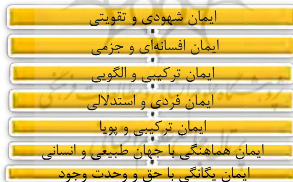
شکل ۴. (لطف‌آبادی، ۱۳۸۰، ب: ۱۰۰)

مایه‌ی رشد استدلال اخلاقی کودکان می‌دانست. به‌زعم وی، رشد اخلاقی فرایندی پیوسته است که در بازه‌ی زمانی عمر یک شخص صورت می‌گیرد. کلبرگ نتوانست میان بیان اخلاقی و رفتار اخلاقی تفاوت بگذارد. لطف‌آبادی، با توجه به کاستی‌های بنیادی نظریه‌های فروید، پیاژه و کلبرگ توانسته است با تکیه بر فلسفه‌ی خردگرایی علمی و عرفان اسلامی ایرانی، افق تازه‌ای را در برابر مسیر رشد اخلاقی بگشاید. وی بر این باور است که یافته‌های روان‌شناسی که در بستر فرهنگ غربی شکل گرفته‌اند نباید به فرهنگ شرقی تعمیم داده شوند. در نظر وی، آزمون‌های رشد اخلاقی که پیاژه و کلبرگ ارائه داده‌اند «صرفاً قضاوت اخلاقی و یادگیری قوانین و مناسبت‌های اجتماعی زندگی در کشورهای غربی را مبنای نظریه‌ی خود قرار داده‌اند و به بنیان‌های روحانی و عقلانی و انگیزشی در اخلاق، که ریشه در خلقت الهی و فطرت آدمی دارند، توجهی نداشته‌اند» (لطف‌آبادی، ۱۳۸۴: ۴۶). لطف‌آبادی با بهره‌گیری از فلسفه‌ی واقع‌بینی و خردگرایی و با توجه به اصول مشترک فلسفه و عرفان اسلامی ایرانی، هفت دوره را در فرایند رشد ایمان دینی و اخلاقی مؤثر می‌داند که در شکل زیر مشاهده می‌شوند: