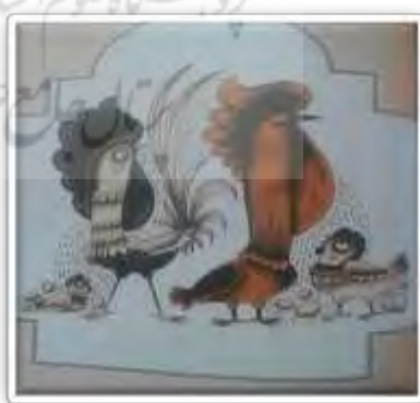
تصویر شماره ۳ (قاسم‌زاده، ۱۳۹۹: ۲۸۱) تصویر شماره ۴ (قاسم‌زاده، ۱۳۹۹: ۴۷)