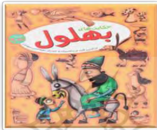
شکل ۱. حکایت‌های بهلول (قاسم‌زاده، ۱۳۹۹: ۱)

بار نشر آرایان در سال ۱۳۹۵ با قطع وزیری و به صورت رنگی منتشر کرد که با استقبال گسترده‌ای روبه‌رو شد و در زمان کوتاهی به چاپ پنجم رسید. این کتاب دو بخش دارد که بخش نخست شامل ۲۳۰ حکایت با متن‌هایی نسبتاً کوتاه است و بخش دوم، در بردارنده‌ی ضرب‌المثل‌ها و اشعاری از سعدی، عطار و مولوی درباره‌ی بهلول است: