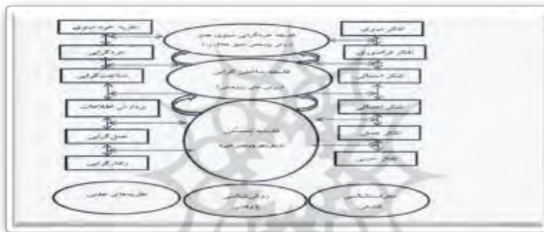
نمودار ۱. چارچوب نظری روش پژوهشی اصیل خلاق (لطف‌آبادی، ۱۳۸۵: ۷۳)

ادبیات هدف‌های مهم‌تر و اساسی‌تری برای ما مطرح است که باید پایه‌هایش را از همان خردسالی در بچه‌ها ایجاد و تقویت کنیم تا موقعی که بزرگتر می‌شوند و در جوانب دیگر زندگی علمی و تجربی و شناختی و اجتماعی و فرهنگی نیز رشد می‌کنند» (لطف‌آبادی، ۱۳۶۵: ۵۵). این روان‌شناس برجسته‌ی ایرانی، تحول اخلاقی کودکان و نوجوانان را پدیده‌ای پویا، تدریجی، طولانی و تراکمی می‌داند. وی برای رسوخ به کُنه مفاهیم ژرف پدیده‌های چالش‌برانگیز روانی تربیتی باتکیه بر خردگرایی مینوی علم که ریشه در فلسفه‌ی اسلامی دارد، چارچوب نظری و مشخصه‌های آن را به صورت زیر ترسیم کرده است: