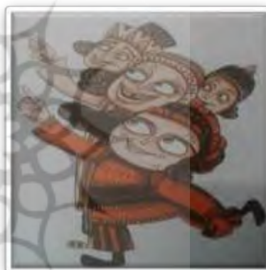
تصویر شماره ۱ (قاسم‌زاده، ۱۳۹۹: ۲۷۱) تصویر شماره ۲ (قاسم‌زاده، ۱۳۹۹: ۳۰۸)