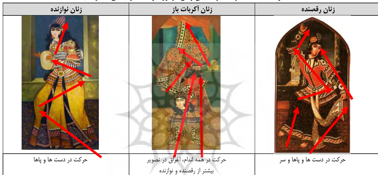
جدول ۱. مطالعه حرکت در نقاشی زنان در دوره اول قاجار.

این موارد نشان می‌دهد حرکت در نقاشی زنان بیشتر از سایر پیکرنگاری‌های این دوران بوده و حرکت در تصویر نقاشی دیده می‌شود و پیکری که در حال جنبش است و هنرمندان در ارائه نمایش حرکت موفق عمل کرده‌اند. در این میان نقاشی زنان رقصنده بیشتر از نوازندگان و آکروبات باز دارای حرکات اغراق آمیز است.