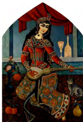
تصویر ۵. زن نوازنده قاجار، هنرمند ناشناس، تهران، قرن ۱۹ میلادی ۱