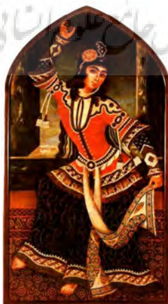
تصویر ۴. زن رقصنده قاجار، ۲۰×۹، موزه جورجیا (برتریت‌های قاجار، ۲۰۰۴: ۲۵)

این موارد نشان می‌دهد حرکت در نقاشی زنان بیشتر از سایر پیکرنگاری‌های این دوران بوده و حرکت در تصویر نقاشی دیده می‌شود و پیکری که در حال جنبش است و هنرمندان در ارائه نمایش حرکت موفق عمل کرده‌اند. در این میان نقاشی زنان رقصنده بیشتر از نوازندگان و آکروبات باز دارای حرکات اغراق آمیز است.