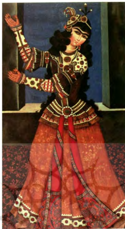
تصویر ۱. زن رقصنده با قاشقک موسیقی، هنرمند ناشناخته، ایران، اوایل قرن ۱۹، رنگ و روغن روی بوم، ۹۰ × ۱۵۸ سانتی متر، موزه ارمیتاژ، سن پترزبورگ، به شماره IIIO – VR. (دیبا، ۱۹۹۹: ۲۶۳)

«این تصویر یک نمونه زیبا از موضوع مورد علاقه از زنان در نقاشی درباری قاجار است. نمایش زنان رقصنده، نوازندگان و آکروبات بازان از موضوعات تزئینی این دوران است. به طور معمول در نقاشی‌های زیبای این دوره با موضوع زن‌ها که نه تاریخ و نه امضا مشخصی دارد، سبک لباس زنان در نقاشی‌ها یکی است و بارها توسط مسافران اروپایی و روسی و دیپلمات‌ها توصیف شده است. این نقاشی (تصویر ۱) متعلق به اوایل قرن نوزدهم میلادی است، علاوه بر این تصویر که از موزه ارمیتاژ قصر موزه گتچین ۱ ، چهار نقاشی دیگر نیز وجود دارد که همه آنها به دوره سلطنت فتحعلی شاه قاجار تعلق دارند و مانند بسیاری دیگر از بوم‌های قاجار زنان را در حال رقص با سازهای موسیقی نشان می‌دهند. این اثر یکی از مجموعه نقاشی‌هایی است که برای تزئینات داخلی کاخ‌ها استفاده می‌شده است. در نقاشی دیگری از این مجموعه دختران رقصنده و نوازنده در موزه فاین آرت تفلیس گرجستان به شماره ۸۵۶/ ۸۵۷ قرار دارند. صورت‌ها مشابه این بوم نقاشی تکرار شده و تاکید هنرمند بر این مشابهت تاکید شده است. زنان نمایش داده شده در مقابل یک پنجره باز با الگوی تیره و روشن نشان داده شده‌اند و بوم‌ها دارای یک سایز و قالب یکسان است» (دیبا، ۱۹۹۹: ۲۶۳). تصاویر ۳-۲ آکروبات بازان و رقاصان دربار قاجار را نشان می‌دهد که تعداد تصاویر قابل توجهی نقاشی از زنان ایرانی در دوره قاجار توسط نقاشان هستند.