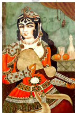
تصویر ۷. زن نوازنده، رنگ روغن روی بوم، ۵۳ در ۸۰، ۱۸۱۶م، احتمالاً ابوالقاسم ۲