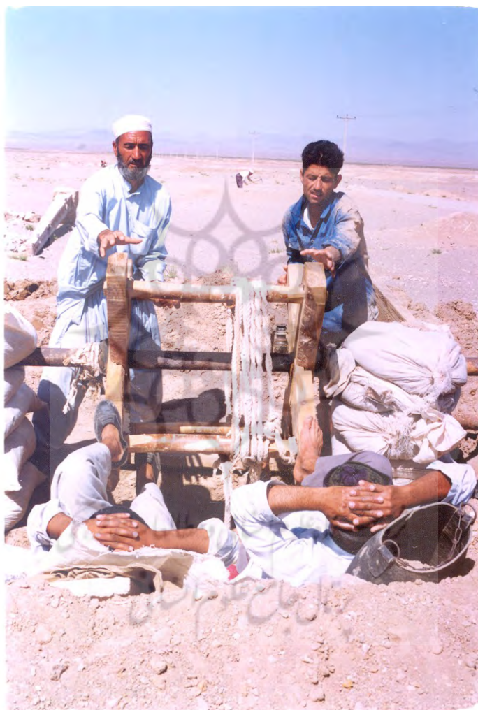
عکس ۳- لارویی و حفر کاریز در جنوب خراسان (ساکماق، ۱۳۸۹: ۳۱۲۶۵).

در هر ماه یک مرتبه به درون آن رود و اطراف و جوانبش را به دقت بررسی کند تا اگر در محلی مقداری گل ریزش کرده، بلافاصله براشته شود. دیگر اینکه در آغاز هر سال کاریز را از رسوبات لارویی و تنقیه کنند.» (کرجی، ۱۳۴۵: ۱۲۱-۱۲۰).