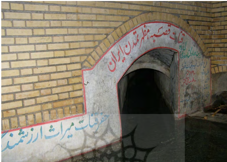
عکس ۱- نمایی از مظهر کاریز قصبه گناباد (ساکماق، بی تا: ۱۰۱۲۷۲).