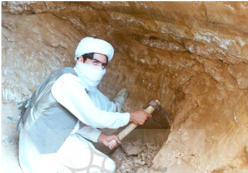
عکس ۱- کاریز کنی در تربت جام (ساکماق، ۱۳۸۹: ۳۱۲۳۹).