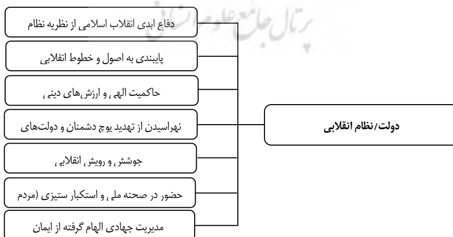
نمودار ۵. مؤلفه‌های دولت یا نظام انقلابی

با انقلاب اسلامی، کشور توانست از جنبه نظری و بعد عملی عینیت یابد و تجلی و بازتاب بیرونی و خارجی پیدا کند (خرمشاد، ۱۳۸۸، ص ۴۷). انقلاب ایران برخلاف انقلاب‌های دیگر، فراگیرتر (با حضور مردم و طبقات مختلف) و بر مبنای معنویات و ارزش‌های انسانی است؛ ارزش‌هایی که در انقلاب‌های مادی‌گرا همچون کمونیستی روسیه و لیبرالیستی فرانسه وجود ندارد. برای اینکه بعد دولت یا نظام انقلابی بتواند در جهت استحکام نظریه نظام انقلابی نقش اصلی خود را ایفا نماید، باید از مؤلفه‌های زیر برخوردار باشد: