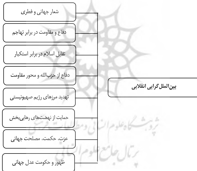
نمودار ۲. مؤلفه‌های بین‌الملل‌گرایی انقلابی

در بخش سلبی، مهم‌ترین مباحث عینی شامل پیروزی انقلاب اسلامی و تهدید منافع راهبردی شوروی و آمریکا (نه شرقی و نه غربی)، از دست دادن ژاندارمی ایران در خلیج‌فارس و منطقه، مقابله با نظام سلطه و نابودی تروریسم در منطقه و جهان اسلام (داعش)، تضعیف جایگاه رژیم صهیونیستی، سازش‌ناپذیری با سلطه، نپذیرفتن نظم بین‌المللی و ایستادگی در برابر قدرت مسلط جهان، مقاومت، حمایت از نهضت‌های رهایی‌بخش (در منطقه و آمریکای لاتین) (ابوالحسن شیرازی و پارسه، ۱۳۹۳، ص ۱۰۸-۱۰۳)، از مهم‌ترین نمونه‌ها در عرصه بین‌الملل‌گرایی انقلاب اسلامی است.