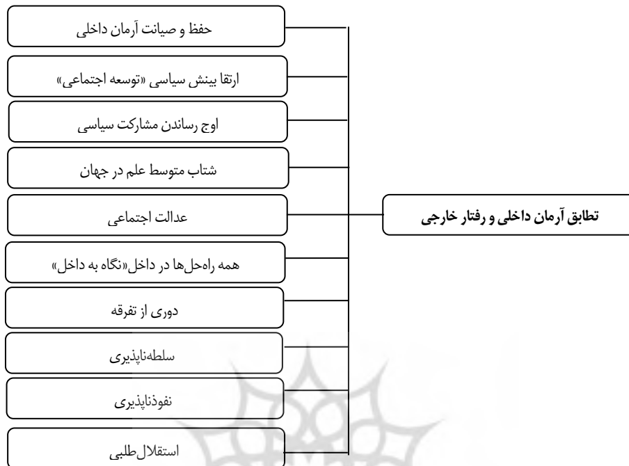
نمودار ۳. مؤلفه‌های تطابق آرمان داخلی و رفتار خارجی