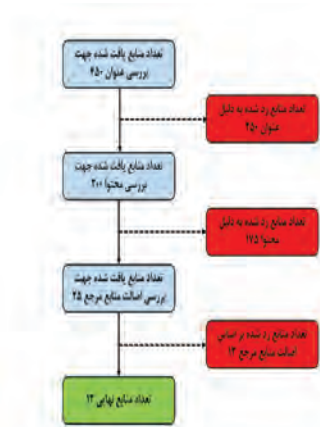
شکل ۳: شیوه انتخاب منابع مناسب برای تحلیل

مرحله چهارم: استخراج نتایج؛ مطابق جدول ۷ این فرایند برای ۱۲ منبع انتخاب شده بر اساس سال و نام صاحب نظر صورت گرفته است.