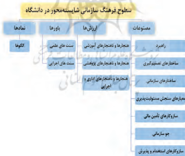
شکل ۴: مدل مفهومی پژوهش

بر اساس یافته‌های حاصل از جدول ۱۰ اولین سطح فرهنگ سازمانی با عنوان مصنوعات در سه دسته کلی راهبرد، ساختارهای تصمیم‌گیری، ساختارهای سازمانی، معیارهای سنجش مسئولیت‌پذیری، سازوکارهای تأمین مالی، جو سازمانی و سازوکارهای استخدام و پذیرش شناسایی گردید. در سطح دوم با عنوان ارزش‌ها مواردی چون، هنجارها و ناهنجارهای آموزشی، پژوهشی و اداری و اجرایی استخراج گردید. سطح سوم با عنوان باورهای بنیادین، مؤلفه‌هایی چون سنت‌های علمی و عمومی تبیین گشت و در آخرین سطح به نمادها شامل الگوهای تکاملی (انطباقی و اقتضایی)، الگوهای شناختی-اجتماعی (از دیدگاه‌ها و نگرش‌ها تبعیت می‌کنند)، الگوهای سیاسی (قدرت و حرکت‌های اجتماعی، چانه‌زنی و نقش قدرت، غیرخطی)، الگوهای برنامه‌ای (مأموریت‌محور و خطی)، الگوهای فرهنگی (وابسته به تاریخ و سنت‌ها)، چرخه زندگی (با محوریت انسان) و الگوهای چندگانه اشاره شد که ترکیبی از الگوها می‌باشد. در واقع این چهار سطح فراترکیب نشان‌دهنده ویژگی‌های مشخص فرهنگ سازمانی اند که بر شایستگی محوری دلالت دارند. در نهایت می‌توان یافته‌های مذکور را به صورت مدل مفهومی زیر (شکل ۴) نشان داد: