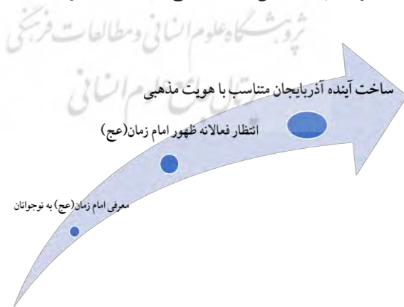
نمودار ۲. دال‌های اساسی نسخه ترکی جمهوری آذربایجان

در این نسخه به شهدا و رزمندگان جنگ دوم قره‌باغ نیز اشاره شده و آن‌ها را در مکتب اهل بیت (علیهم‌السلام) می‌نامد. در هنگام این بازنمایی، رزمندگان در حال سینه‌زنی هستند و بلافاصله به موضوع انتقام از قاتلان حاج‌قاسم اشاره می‌شود. یعنی بعد از جنگ قره‌باغ، نیروهای آذربایجانی به جهت انتقام از قاتلان حاج‌قاسم وارد نبرد خواهند شد. از جمله موارد دیگر حائز اهمیت در نماهنگ این نسخه، پوشیدن چادر سیاه از روی لباس نظامی هنگام آماده‌شدن برای حرکت به سوی یاری امام زمان (عج) می‌باشد. چادر و حجاب اسلامی در جمهوری آذربایجان از ارزش والایی برخوردار است. در برنامه‌های مختلف تلویزیونی و در صحبت با اقشار مختلف توسط نگارنده مشاهده شده که گاه ارزش چادر چنان بالا می‌باشد که خانم‌های بی‌حجاب و حتی خواننده خود را لایق چادر نمی‌دانند و در آرزوی رسیدن به مقامی هستند که آن روز لایق چادر باشند و حجاب سر کنند. در نمایش این نسخه نیز، در ابتدا خانم خواننده چادر نپوشیده و لباسی نظامی بر تن دارند اما زمانی که به لیاقت یاری امام زمان (عج) نائل می‌شوند، چادر به سر می‌کنند. این سرود به عنوان نمادی از فرهنگ مقاومت شیعیان در دنیا شناخته شد و انتشار گسترده نسخه‌های ترکی این سرود در بین مردم آذربایجان به حدی است که حتی در مراسمات عروسی و تولد نیز این سرود زمزمه می‌شد و این نشانگر نفوذ فرهنگ مقاومت بین اقشار مختلف، خصوصاً جامعه دین‌دار (مذهبی) آذربایجان بود.