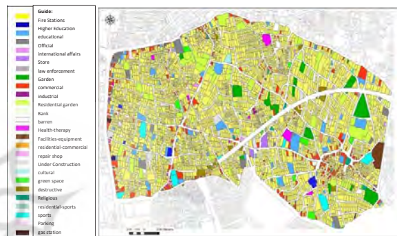
Fig. 2. Land use map (Region 1 municipality, 2015)