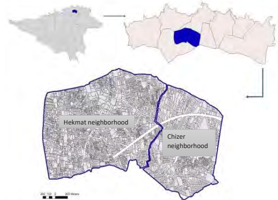
Fig. 1. Introduction of the study area

و کاربری‌های خدماتی و تجاری در جداره خیابان‌های اصلی و یا در مرکز محله چیدر قرار دارند.