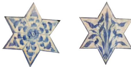
تصویر ۴: نقوش گیاهی کاشیکاری بنا. (نگارنده، موزه آمل)

برای خواندن و درک فضای معماری ایرانی ابتدا باید بخش ترکیبات فضایی در معماری ایران را شناخت سپس موجودیت