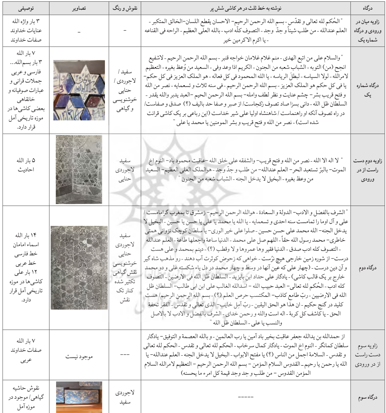
جدول ۱. تحلیل توصیفی نقوش بنای سلطان شهاب‌الدین