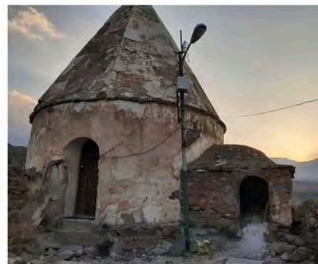
تصویر ۱. بنای ساده گچ‌کاری شده در طول زمان؛ از چپ به راست: الف. سال ۱۳۵۵، عکاس: منوچهر ستوده (ستوده، ۱۳۷۴: پیوست)، ب. سال ۱۳۹۳، عکاس: نامشخص، ج. عکاس: نگارنده (در حاجی دلا، ۱۴۰۲).