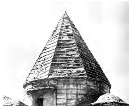
تصویر ۳. گنبد مخروطی، عکس از منوچهر ستوده ۱۳۵۵. (ستوده، ۱۳۷۴)

مشهور فلاسفه، حرکت در مقوله جوهر را نپذیرفته و فقط به حرکت در چهار مقوله عرضی کم، کیف، آین و وضع قائل بوده‌اند. اما حکیم صدرالمآلهین شیرازی، معتقد است که حرکت منحصر به أعراض نبوده بلکه در جوهر و ذات اشیاء نیز جاری است (طباطبایی، بی‌تا: ۱۲۸). او در مجلد سوم کتاب اسفار، به تفصیل و بر اساس دلایل عقلی و نقلی، اثبات کرده است که صورت نوعیه به عنوان گوهر و ذات شیء، پیوسته تبدیل می‌یابد و به تکامل می‌رسد.