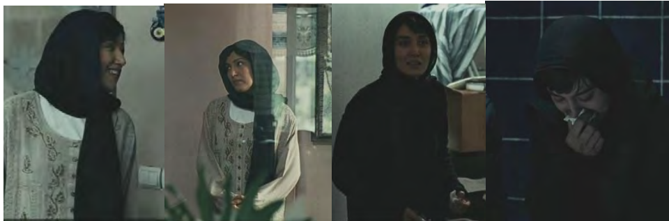
تصویر ۳. دو تصویر راست مژده را نشان می‌دهند که همیشه عصبی و نالان است و در