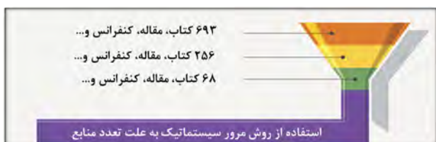
تصویر ۴. روش انتخاب منابع و مآخذ.

به منظور ترکیب و تلفیق نتایج از روش تلفیق کیفی استفاده شده است. بدین منظور روش تحلیل مضمون ۳۳ به کار گرفته شده است. این تکنیک روشی برای تجزیه و تحلیل داده‌های کیفی است. بویاتزیس ۳۴ (Boyatzis, 1998) تحلیل مضمون را روشی برای شناخت، تحلیل و گزارش الگوهای موجود در داده‌های کیفی می‌داند. این روش، فرایندی برای تحلیل داده‌های متنی است و داده‌های پراکنده و متنوع را به داده‌هایی غنی و تفصیلی تبدیل می‌کند (درخشه و همکاران، ۱۳۹۴، ۵۲). تحلیل مضمون، فقط روش کیفی خاصی نیست؛ بلکه فرایندی است که می‌تواند در بیشتر روش‌های کیفی به کار رود. به‌طور کلی تحلیل مضمون، روشی است برای دیدن متن، برداشت و درک مناسب از اطلاعات ظاهراً نامرتبط، تحلیل اطلاعات کیفی، مشاهده نظام‌مند شخص، تعامل، گروه، موقعیت،