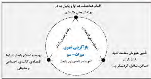
تصویر ۲. تعریف بازآفرینی میراث- سو. مأخذ: نگارندگان.

محیطی و در نتیجه حل مشکلات آن؛ به طوری که منفعت تمامی کنش‌گران و افرادی که در آن زندگی می‌کنند، کار می‌کنند و از آنجا بازدید می‌کنند، تأمین شود و دستاوردهای اقتصادی، رقابت‌پذیری پایداری محیط‌زیستی و اجتماعات محلی از پیامدهای آن باشد.