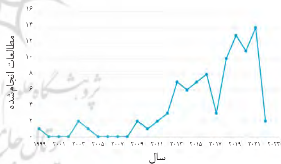
تصویر ۵. توزیع فراوانی مطالعات انجام‌شده بر اساس تحلیل زمانی داده‌های پژوهش.

بیشترین پژوهش‌های انجام شده در این زمینه در کشورهای انگلستان، ایتالیا، چین و ترکیه انجام شده