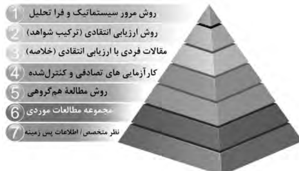
تصویر ۳. هرم طرح‌های پژوهشی.

با درجه بالایی از تجزیه و تحلیل کمی، بررسی، تجزیه و تحلیل و روش علمی دقیق مشخص می‌شود، در رأس هرم قرار دارند (CRD, 2008). روش مرور سیستماتیک ۳۴ به مثابه یکی از انواع طرح پژوهش نوعی مرور متون است که با تمرکز بر یک پرسش واحد می‌کوشد تمامی شواهد پژوهش‌های مهم مرتبط با آن را شناسایی، ارزیابی، انتخاب و تلفیق کند. هدف این ارزیابی سیستماتیک، سنجش متون جدید درباره بازآفرینی پایدار میراث-سو به کمک شناسایی و سنتز مطالعات جدید قابل دسترس در این حوزه خاص است. روش ارزیابی سیستماتیک از رویکرد ارزیابی ادبیات نظریه زمینه‌ای و فلسفینکل ۳۵ و همکاران (Wolfswinkel et al., 2013) پیروی می‌کند. از دیدگاه ایشان، مراحل تکرارشونده ارزیابی سیستماتیک عبارت است از تعریف ۳۶ ، جست‌وجو ۳۷ ، انتخاب ۳۸ ، تحلیل ۳۹ و سنتز ۴۰ ؛ که در ادامه به بررسی هریک از آن‌ها پرداخته می‌شود.