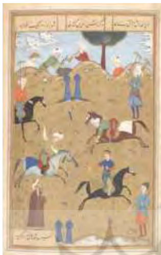
تصویر ۱- شاه و درویش در زمین چوگان، برگي از مثنوی گوی و چوگان نوشته عارفی، اواخر قرن دهم/ شانزدهم، اندازه: ۱۲۳×۱۹۴ میلی متر، گالری هنر فریر/سکلر (شماره دسترسی: F1935.19)، واشنگتن (مآخذ: URL5). منبع: غیاثیان و افشاری، ۱۳۹۹، ص. ۶۳

چهار نگاره در مثنوی «گوی و چوگان» سروده عارفی هروی، موجود است. سه تصویر برگرفته از یکی از نسخه‌های موجود در موزه آرمیتاژ و یک تصویر از نسخه موجود در کتابخانه کاخ گلستان است. سه نگاره اول از کتاب «لوحه‌های نگارین» نوشته اشرفی (اشرفی، ۵۰) که مربوط به سال ۹۲۹ هجری قمری در دوره صفوی و مکتب تبریز است و تصویرگر آن نیز مشخص نیست. چهارمین نگاره برگرفته از نسخه موجود در کتابخانه کاخ گلستان است، این نسخه دارای دو تصویر است که متأسفانه در هیچ‌یک از این دو اثر (که البته ناتمام هم هستند) نام و مشخصات نگارگر آن ثبت نشده است. مثنوی «گوی و چوگان» که به «حالنامه» نیز مشهور است توسط عارفی در حدود سال‌های ۸۵۴ هجری قمری در ۵۰۰ بیت سروده و به فرزند شاهرخ تیموری اهدا گردیده است (فاضلی و ریاضی، ۱۳۸۹، ص. ۸۴).