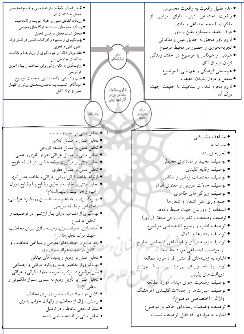
شکل (۱): الگوی نظری حاصل از کدگذاری محوری

در ادامه الگوی مستخرج از کدگذاری محوری آورده می‌شود.