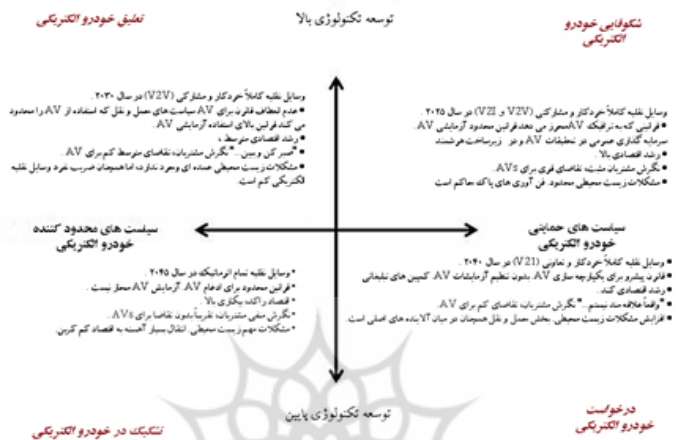
شکل (۲): سناریوهای آینده سناریوهایی در مورد توسعه و به‌کارگیری وسایل نقلیه خودران در هلند

حالت‌های مختلف فراهم می‌کند که سریع‌تر، ارزان‌تر، تمیزتر، ایمن‌تر و راحت‌تر از امروز است (Corwin & Pankratz, 2017). میلاکیس و همکاران (۲۰۱۶) بر اساس سطح توسعه فناوری و سیاست‌گذاری حمایتی یا محدودیتی ۴ سناریو با تمرکز بر خودرو الکتریکی به‌عنوان محور اصلی در کشور هلند شکل داده است. در شکل (۲) ویژگی‌های کلیدی هر سناریو ارائه شده است (Milakis, et al., 2016).