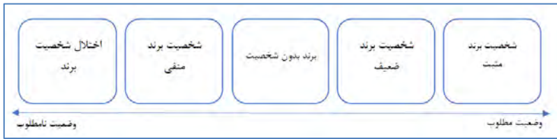
شکل ۱. چارچوب اولیه وضعیت‌های کیفیت شخصیت برند