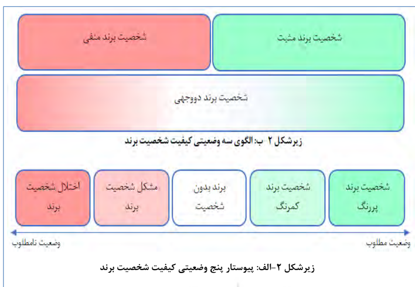
شکل شماره ۲. چارچوب نهایی کیفیت شخصیت برند

در چارچوب نهایی کیفیت شخصیت برند، پنج وضعیت کیفیت شخصیت برند (پررنگ؛ کم‌رنگ؛ بدون شخصیت؛ مشکل شخصیت؛ اختلال شخصیت) در قالب طیفی از وضعیت مطلوب تا نامطلوب قرار داده شده و در زیر شکل ۲-ب نمایش داده شده است و سه وضعیت دیگر (مثبت؛ منفی؛ و دووجهی) با توجه به دشواری ارزش‌گذاری و طیفی نگاه کردن به آن‌ها، در قالب زیر شکل ۲-الف قرار داده شده است؛ زیرا ممکن است برندی به صورت آگاهانه و ارادی شخصیتی منفی را برای خود انتخاب کرده باشد و بنابراین وضعیت مطلوبی را برای خود متصور باشد. در این حالت نمی‌توان ارزش‌گذاری کرد و کیفیت شخصیت برند منفی را نامطلوب توصیف کرد. در شکل چارچوب کیفیت شخصیت برند ارائه شده، بزرگی و کوچکی کادرها به معنای اهمیت هر کدام از حالت‌ها نسبت به سایر حالت‌ها نیست، بلکه