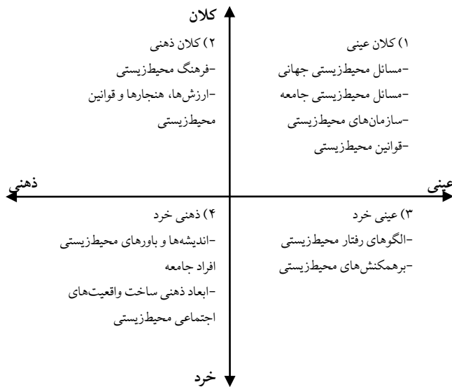
شکل ۳. سطوح عمده پارادایم بساختی- تفسیری مسائل محیط‌زیست

دو پیوستار خرد- کلان و عینی- ذهنی بسیار اهمیت داشته و در مطالعات مبتنی بر بساخت مسائل محیط‌زیستی کاربرد بالایی دارند. آنچه در این مقاله به دنبال آن هستیم روابط متقابل این دو پیوستار و ساخت یک الگوی منسجم در مطالعه بساخت مسائل محیط‌زیستی است. شکل ۳ این الگورا نشان می‌دهد که از تقاطع دو پیوستار قبلی حاصل شده و چهار سطح واقعیت‌های اجتماعی را نشان می‌دهد.