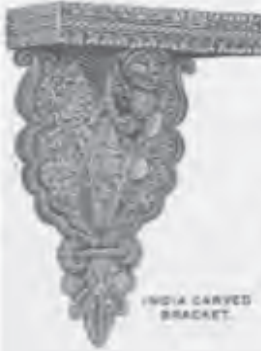
INDIA CARVED BRACKET.