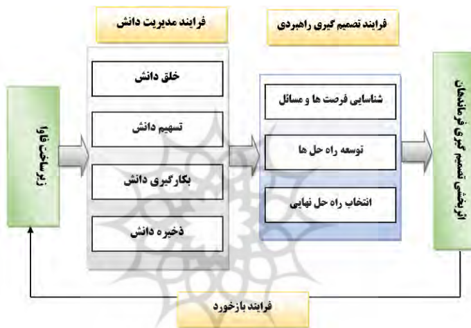
شکل ۳: الگوی اثربخشی فرایند مدیریت دانش بر تصمیم‌گیری راهبردی

تصمیم‌گیری یک فعالیت است که به تک‌تک افراد سازمان بر می‌گردد یعنی هرکدام از کارکنان یک سازمان در موقعیت‌های مختلف تصمیم‌گیری‌هایی دارند که می‌توانند در این تصمیم‌گیری از خرد جمعی نیز بهره‌مند شوند، لیکن این فعالیت یک فعالیت فردی محسوب می‌شود و از نظر تعمیم به سازمان در لایه‌های زیرین و ابتدایی سازمان قرار دارد.