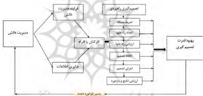
شکل ۲: مدل مفهومی تحقیق

هدایت تحقیقات بیشتر در توسعه نسل بعدی و محیط‌های پشتیبانی تصمیم‌گیری باشد.