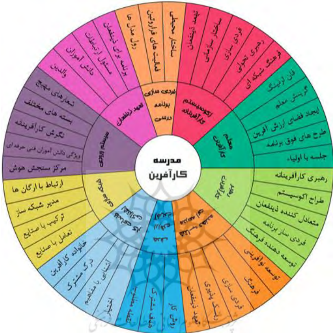
شکل ۲. مدل مدرسه کارآفرین (منبع: یافته‌های پژوهش)

مؤلفه اول مدرسه کارآفرین با عنوان «استقرار اکوسیستم کارآفرینانه» همسو با پژوهش‌های پیشین ارائه شده است. اکوسیستم مجموعه‌ای از دورنماهای فرهنگی متمرکز، شبکه‌های اجتماعی، حمایت مالی، مؤسسات آموزشی و سیاست‌های اقتصادی فعال است که برای کسب‌وکارهای مخاطره‌آمیز، محیط‌های حمایتی فراهم می‌کند (داوری و همکاران، ۱۳۹۶). یک اکوسیستم کارآفرینی به‌عنوان مجموعه‌ای از بازیگرانی که به هم وابسته‌اند تعریف می‌شوند که به نحوی عمل می‌کنند که کارآفرینی را فعال می‌سازند. این ساختار و فرایند در یک شرایط خاص نهادی و فیزیکی قرار دارد که اداره و اقدام بعدی فرایند کارآفرینی را ممکن یا محدود می‌سازد (حاجی‌آقایی و خلخال، ۱۳۹۸، استام، ۲۰۱۴). این نشان می‌دهد که بدون استقرار یک اکوسیستم کارآفرینانه در مدارس، امکان بسط عملی کارآفرینی وجود ندارد.