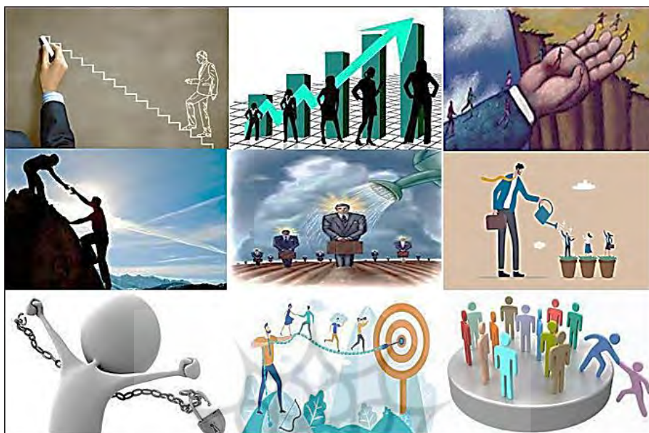
شکل ۱. تصاویر ارائه شده به وسیله برخی از مشارکت کنندگان