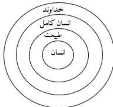
«تصویر ۲»: نقش طبیعت در تعلیم اسماء (ترسیم: نگارنده)

و قیل له (ع): صف لنا العاقل فقال (ع): هو الذی یضع الشئ مواضعه (فقیل: فصف لنا الجاهل) فقال قد فعلت. یعنی ان الجاهل هو الذی لا یضع الشئ مواضعه فکان ترک صفته صفة له اذ کان بخلاف وصف العاقل: و او را گفتند خردمند را برای وصف فرما. فرمود خردمند آن بود که هر چیزی را به جای خود نهد. پس او را گفتند نادان را برای ما وصف کن؛ گفت: وصف کردم معنی آن این است که نادان آن بود که هر چیز را بدانجا که باید نهد پس گویی ترک وصف، او را وصف کردن است چه رفتارش مخالف خردمند بودن است. (نهج البلاغه، ۱۳۶۸: ۲۳۵) «طبیعت به عنوان اولین و ملموس ترین [بدهی‌ترین] مدرک درک شده توسط حواس انسان حاوی پیامی است، پیام معنوی طبیعت بر علم مقدس مبتنی است و به واقعیت هستی شناختی طبیعی نظر دارد. چیزی که انسان جدید به علت نوع تربیت، قادر به دریافت آن نیست» (نصر، ۱۳۷۹: ۲۰۲) تربیت حقیقی در حقیقت همان تعلیم اسماء بوسیله عقل است. انسان به عنوان جزئی از طبیعت با ادراک اسماء به انسانی واقعی تبدیل می‌گردد که البته تمامی این مراحل با تعلیم الهی میسر است.