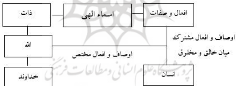
«تصویر ۱»: اسماء الهی (ترسیم: نویسنده)

«ظاهراً آن شاخ اصل میوه است باطنا بهر ثمر شد شاخ هست گر نبودی میل و امید ثمر کی نشاندی باغبان بیخ شجر؟ پس به معنی آن شجر از میوه زاد گر به صورت از شجر بودش ولاد پس به صورت آدمی فرع جهان وز صفت، اصل جهان این را بدان» (مولوی، ۱۳۷۵: ۶۳۷)