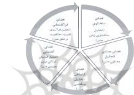
نمودار (۱) الگوی پدام و ۵ فضای مطرح شده در آن Diagram (1) Pedom pattern and 5 spaces mentioned in it

گیرد. پیشا ساختار خود متکی بر عوامل درونی و بیرونی است. از جمله عوامل درونی آن مبانی اعتقادی و جهان بینی امام (ع) است. عوامل بیرونی می تواند بر فضای قدرت، سیاست و عوامل دیگر استوار باشد. ناگفته نماند که عنصر تقیه نیز در برخی موارد نباید فراموش شود. چه بسا گفتمان امام بر اصل تقیه، به عنوان پیشا ساختار، استوار باشد. در واقع تقیه همان گونه که به عنوان عامل درونی محسوب می شود، از عوامل بیرونی حکایت دارد که نیازمند واکاوی است. از این رو، تحلیل فضایی که در آن «تقیه» صورت گرفته است، قراین فراوانی می طلبد (خاکپور و همکاران، ۱۳۹۷: ۸۸ و ۱۳۹۹: ۲۶۹). در ادامه نمودار پنج فضا ارائه می شود.