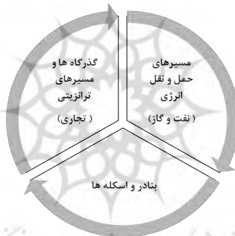
شکل ۲. متغیرهای کلیدی ژئوپلی‌نومیک

در این چارچوب، مقاله حاضر تلاش دارد تا موقعیت ژئوپلی‌نومی اقیانوس هند را به‌عنوان صحنه رقابت و نفوذ قدرت‌های جهانی در بستر ژئوپلیتیک نوین مورد ارزیابی قرار دهد.