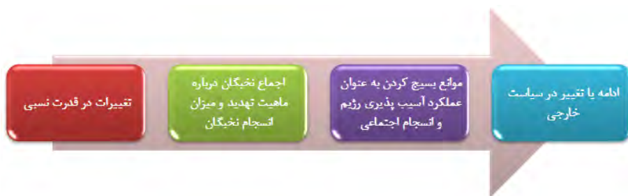
تصویر ۱. زنجیره علی چگونگی تنظیمات سیاسی برای اتفاقات سیاسی از دیدگاه شولر

برای دولت‌های نامنسجم، رویه علی که به تولید «عدم تعادل» منجر می‌شود، ممکن است مشابه با رویه بالا باشد، اما ترتیب منطقی‌تر آن به شکل ذیل است.