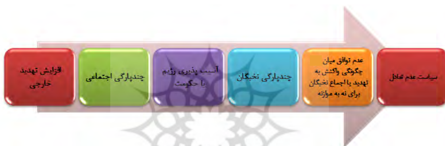
تصویر ۲. رویه علی شکل‌گیری عدم تعادل در سیاست خارجی از نظر شولر

برای دولت‌های نامنسجم، رویه علی که به تولید «عدم تعادل» منجر می‌شود، ممکن است مشابه با رویه بالا باشد، اما ترتیب منطقی‌تر آن به شکل ذیل است.