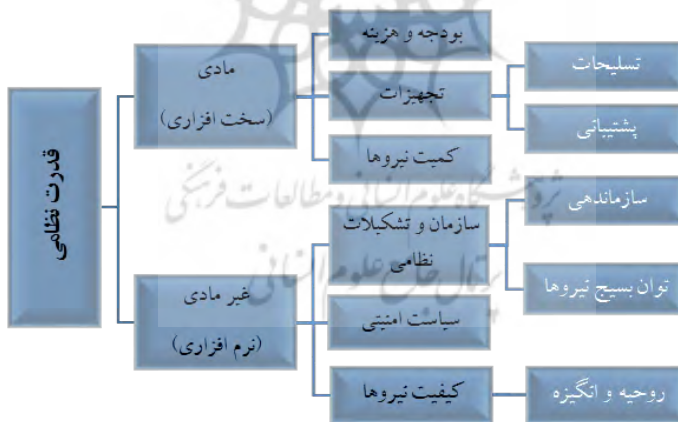
نمودار ۲. عناصر تشکیل دهنده قدرت نظامی

براین اساس، باتوجه به مطالب ذکر شده درباره عناصر قدرت نظامی، یک تقسیم بندی از عناصر قدرت نظامی در نمودار شماره ۲ طراحی شده است. در این نمودار ابتدا عناصر قدرت نظامی به دو بخش تقسیم شده اند و باتوجه به اینکه برخی از عناصر به یکدیگر نزدیک هستند، در کنار یکدیگر قرار می گیرند و دسته بندی جدیدی به وجود آمده است.