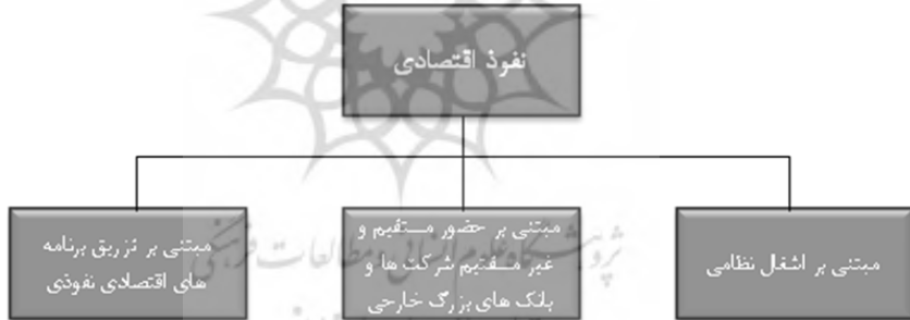
نمودار ۳- انواع نفوذ اقتصادی در یک نگاه

جریان نفوذی همواره تلاش می‌کند با ترویج نسخه‌های نفوذ اقتصادی به عنوان گفتمانی عقلایی، افکار عمومی را به انتخاب مسیر هضم در اقتصاد جهانی وارد سازد. تغییر ذائقه بازار مصرف ایرانی و تسخیر آن با کالاهای خارجی، گام مکمل این پروژه است که از مسیر تبلیغات رقم زده می‌شود. نفوذ نرم اقتصادی بیشتر حول تربیت نخبگان وابسته و تأثیرگذاری بر اندیشه‌های اقتصادی نخبگان مستقل و در سطح عامه مردم بر شکل دهی فرهنگ و رفتار اقتصادی آنان دور می‌زند. در میان اثرگذاری بر اندیشه‌های اقتصادی عمدتاً با پوشش «توسعه» دنبال و نخبگان اقتصادی کشورها با این پوشش موجه تربیت می‌شوند (احمدیان، ۱۳۹۴). هدف غایی این نفوذ، پذیرش همگانی نسخه نفوذی تولید، توزیع و مصرف و سرمایه‌گذاری از سوی نخبگان و عموم افراد جامعه است تا استقلال اقتصادی به تدریج به وابستگی اقتصادی بدل شود. در این مسیر، جامعه یاد می‌گیرد که ایستادگی در برابر نفوذگر و نظام سلطه هزینه سنگین اقتصادی اعم از تحریم و بحران اقتصادی دارد و به صلاح نیست در مقابل، زندگی و معیشت آسان در گرو پذیرش سلطه اقتصادی نظام استکبار و استانداردهای تعریف شده از سوی شرکت‌های چندملیتی است.