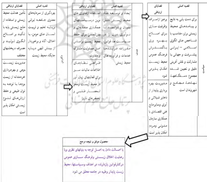
شکل ۳- فرایند رسیدن به نظریه

مرحله پایانی: روندشناسی تکاملی مراحل سه‌گانه مذکور در پیوند قضایای اصلی و ارتباطی و مؤلفه‌های سه‌گانه مدیریتی نشان می‌دهد که «با اصالت دادن به اصل توجه به بنیان‌های نظری و با رعایت اخلاق زیستی و فرهنگ‌سازی عمومی در کنار قوانین بازدارنده در اهداف و سیاست‌ها، محیط زیست پایدار و طیبه در جامعه محقق می‌شود». این عبارت به عنوان محصول موفق و نتیجه مرجح در حوزه محیط زیست است؛ بنابراین می‌توان آن را مبدأ شبه‌نظریه در حوزه محیط زیست دانست.