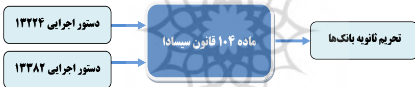
شکل ۴- فرایند تحریم‌های ثانویه قانون سیسادا

تحریم‌های بانکی قانون سیسادا با هدف خارج کردن بانک‌های ایران از نظام بانکداری بین‌المللی و قطع روابط کارگزاری بانک‌های خارجی با بانک‌های ایرانی تنظیم و تصویب شد (Katzman, 2011: 6). براساس دستورهای اجرایی رئیس‌جمهور آمریکا از سال ۲۰۰۶ به بعد بسیاری از بانک‌های بزرگ و اصلی ایران نظیر بانک ملی، ملت، صادرات و سپه به اتهام ارتباط با برنامه هسته‌ای ایران (دستور ۱۳۳۸۲) یا حمایت از تروریسم بین‌الملل (دستور ۱۳۲۲۴) تحریم و با تصویب سیسادا مشمول تحریم ثانویه نیز شدند.