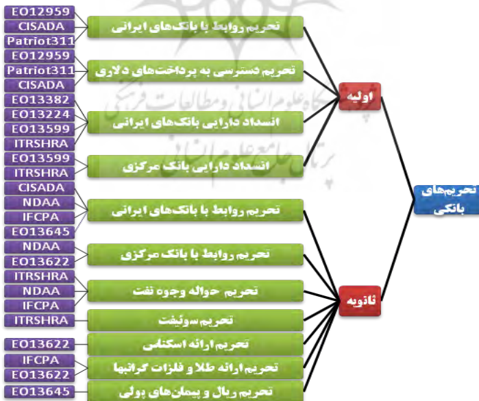
شکل ۶- دسته‌بندی تحریم‌های بانکی بر اساس محتوای تحریم‌ها

تفکیک موضوعی تحریم‌ها و میزان همپوشانی قوانین براساس ساختار تحریم‌های بانکی می‌توان دسته‌بندی موضوعی زیر را از محتوای تحریم‌ها اعمال کرد: