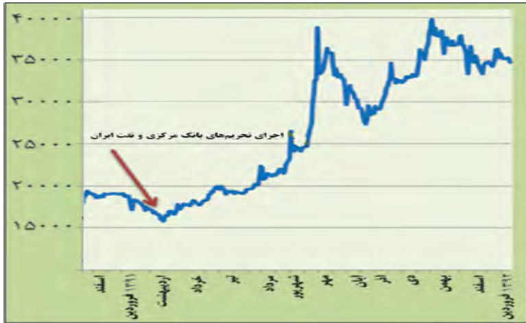
نمودار ۴- روند نرخ ارز در بازار آزاد ایران در سال ۹۱ (منبع: بانک مرکزی)