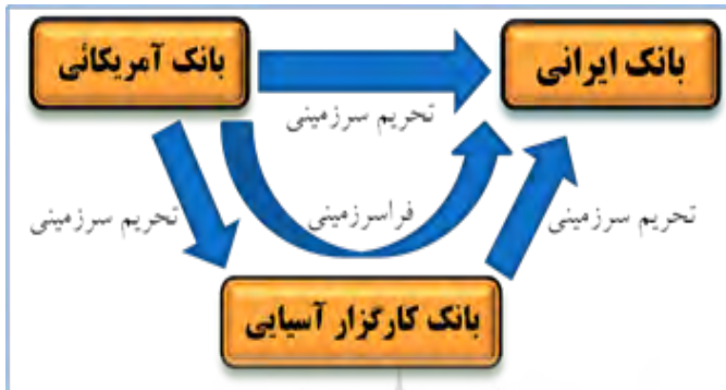
شکل ۳: نحوه عملکرد تحریم‌های ثانویه بانکی

کشور هدف اعمال کند. این تحریم غیرمستقیم عمل می‌کند و در صورت تبعیت کشور ثالث موجب اعمال تحریم فراتر از سرزمین کشور تحریم‌کننده می‌شود که به آن تحریم فراسرزمینی ۱ نیز می‌گویند (Meyer, 2009: 906). تحریم فراسرزمینی بانکی اولین بار و تنها درباره ایران اعمال شده است.