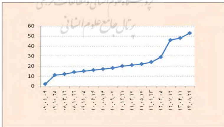
نمودار ۱- روند تحریم اولیه انسداد دارایی بانک‌های ایران

در حال حاضر تحریم‌های اولیه متنوعی در حوزه روابط بانکی ایران و آمریکا وجود دارد که ناشی از پنج قانون تحریمی در آمریکاست. شروع تحریم‌های اولیه بانکی ایران به سال ۱۹۹۵ برمی‌گردد. البته در مقطعی از ابتدای انقلاب هم تحریم‌های بانکی آمریکا علیه ایران وضع و به موجب آن حدود ۱۲ میلیارد دلار از دارایی‌های بانک مرکزی ایران در آمریکا مسدود شد. این تحریم‌ها با معاهده الجزایر و تبادل گروگان‌های آمریکایی لغو شد (Ibid, 2013: 5). در سال ۱۹۹۵ کلینتون، رئیس‌جمهور آمریکا، ایران را تهدیدی برای امنیت ملی آمریکا معرفی و تحریم‌های وسیعی در همه حوزه‌های اقتصادی از جمله بانکی وضع کرد. در این سال ارائه خدمات بانکی از سوی بانک‌های آمریکایی به بانک‌های ایرانی ممنوع شد و دیگر امکان گشایش حساب و برقراری روابط کارگزاری نبود. با وجود این همچنان امکان پرداخت دلاری برای بانک‌های ایرانی فراهم بود. با طرح پرونده هسته‌ای ایران در سال ۲۰۰۶، تحریم‌های آمریکا وارد فاز توقیف دارایی شد و دسترسی بانک‌های ایرانی به دلار قطع گردید. البته به دلیل قطع شدن روابط تجاری ایران و آمریکا پیش از آن، این اقدام تأثیر چندانی بر اقتصاد ایران نداشت. به رغم شروع تحریم‌های ثانویه از سال ۲۰۱۰، تحریم‌های اولیه انسداد دارایی بانک‌های ایرانی همچنان ادامه داشت. در سال ۲۰۱۲ طبق دستور اجرایی ۱۳۵۹۹، تمام بانک‌ها و مؤسسات مالی ایران هدف تحریم انسداد دارایی در آمریکا قرار گرفتند. روند تحریم اولیه توقیف دارایی بانک‌های ایران از سوی آمریکا در نمودار زیر نشان داده شده است: