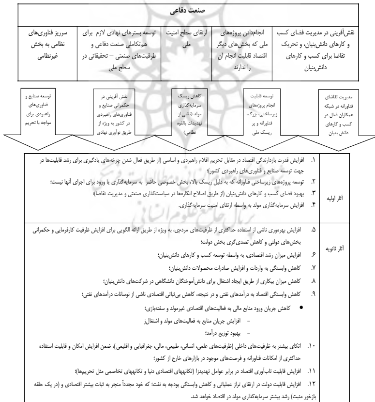
جدول ۳- الگوی تأثیر صنعت دفاعی بر اقتصاد ملی در گذار به اقتصاد مقاومتی

بعد از ارزیابی و اصلاح الگوی اولیه در کارگروه تخصصی گروه کانونی و تأیید اعتبار نتایج توسط اعضا، الگوی نهایی به صورت زیر استخراج شده است: