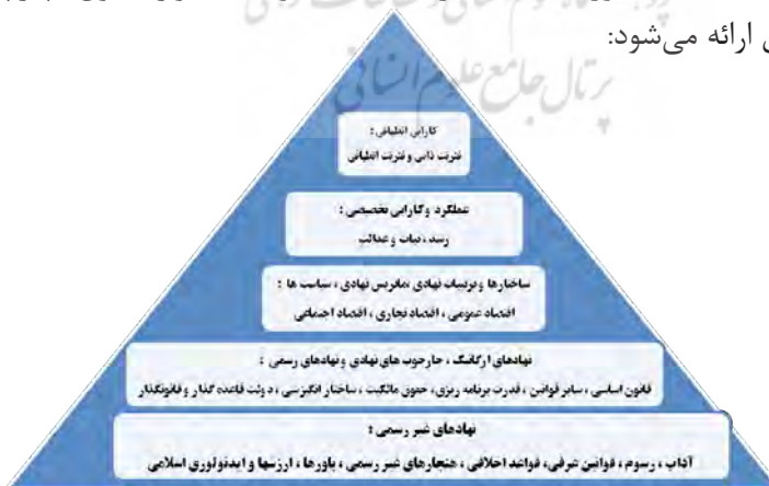
شکل ۳- چارچوب نظری برای طراحی الگوی کارایی اقتصاد مقاومتی جمهوری اسلامی ایران

لذا حضرت امام خامنه‌ای نیز بر پیشرفت و عدالت، در مسیر رشد اقتصادی تأکید دارند و از طرفی، ثبات، رشد و عدالت از اصول اساسی اقتصاد در اصل سیزدهم قانون اساسی است. بنابراین، کارایی تخصیصی باید به سمت رشد، ثبات و عدالت، و کارایی انطباقی نیز به سمت تاب‌آوری اقتصاد حرکت کند. با توجه به موارد فوق، چارچوب نظری تحقیق ارائه می‌شود: