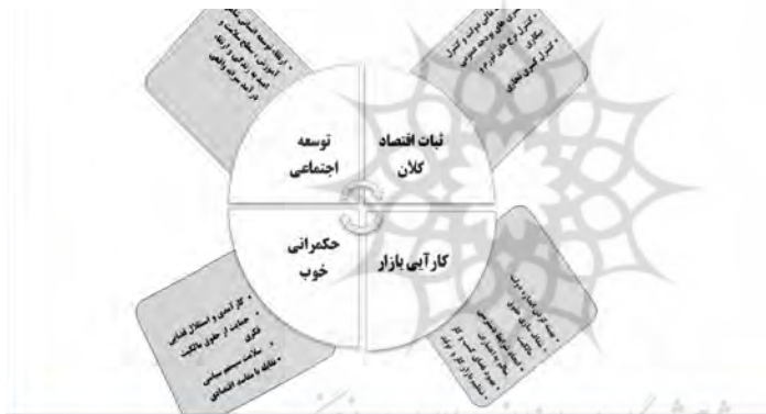
شکل ۲- شرایط لازم برای تاب‌آوری اقتصادی (بریگو گلیو، ۲۰۰۸: ۷)

متغیرهای اصلی تاب‌آوری اقتصادی عبارت‌اند از: اول، متغیرهای اقتصادی که توسط پایداری اقتصادی کلان و کارایی اقتصاد بررسی می‌شوند؛ دوم، متغیرهای اجتماعی - سیاسی که از سوی حکمرانی سیاسی خوب و توسعه اجتماعی مورد بررسی قرار می‌گیرند در شکل ۲ شرایط لازم برای تاب‌آوری اقتصاد و متغیرهای اصلی آن آمده است.