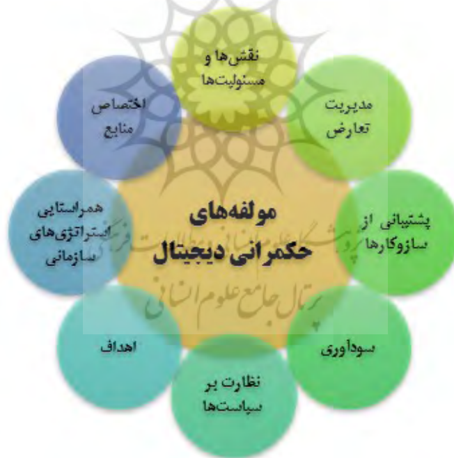
شکل (۱): مؤلفه‌های حکمرانی دیجیتال

حکمرانی دیجیتال، با تعیین وظائف افراد در پیشبرد اهداف تحول دیجیتال نقش مهمی در کنترل روند این تغییر اساسی در سازمان ایفا خواهد نمود. یک حکمران دیجیتال باید به مؤلفه‌های حکمرانی توجه ویژه داشته باشد که شکل زیر نمایش داده شده است.