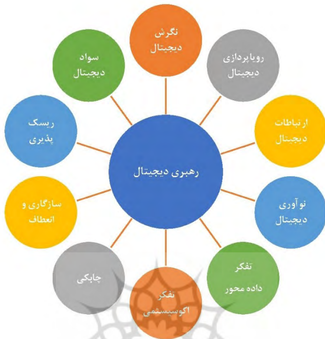
نمودار (۲): ویژگیهای رهبر دیجیتال (برت، ۲۰۲۰)

برت ۱ (۲۰۲۰) در قالب مدلی، ویژگیهای رهبری دیجیتال را در قالب عناصری بیان می نماید.