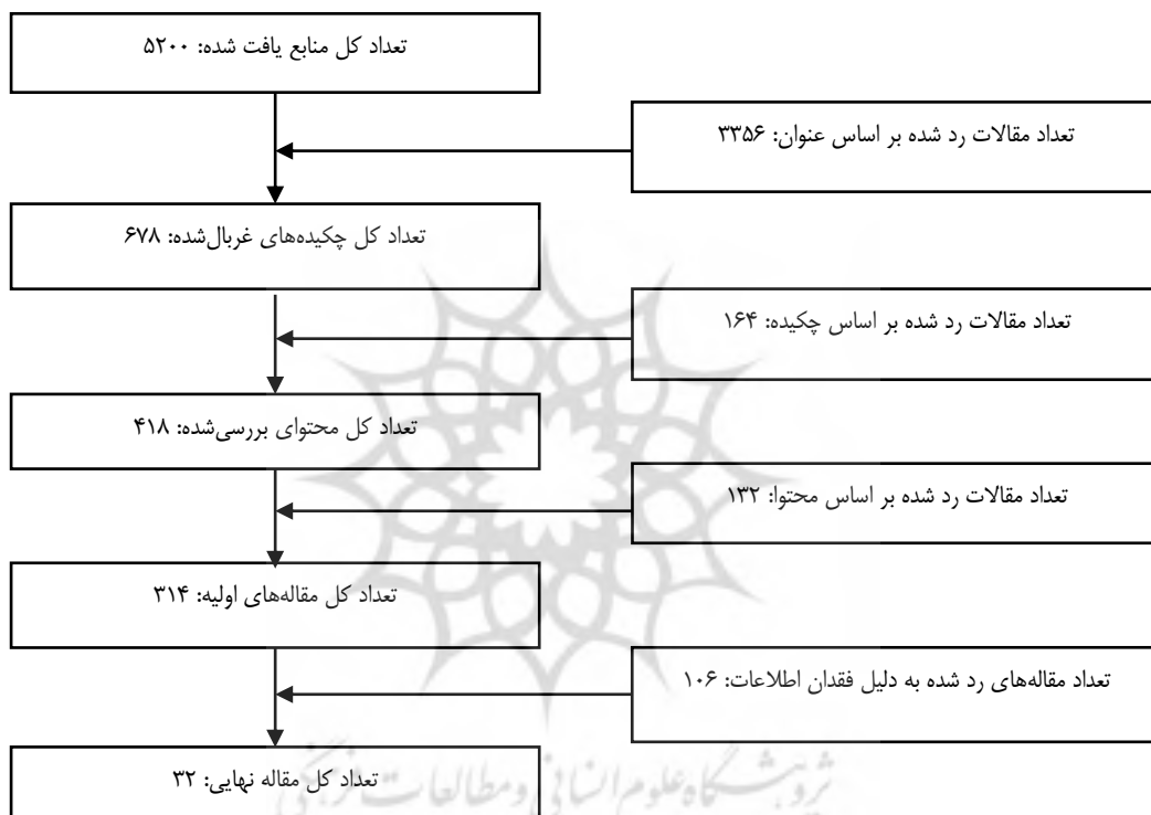
شکل ۱: جستجو و انتخاب مقالات مناسب

در نهایت برای بررسی و تأیید کیفیت محتوای اسناد، از برنامه مهارت ارزیابی (CASP) استفاده شد. این برنامه شاخصی است که به پژوهشگر کمک می‌کند دقت، اعتبار و اهمیت مقالات را مشخص کند. براساس این شاخص به هر مقاله امتیازی بین ۱ (ضعیف) تا ۵ (عالی) داده شد. سپس هر یک از مقالات طبق مجموع امتیاز کسب‌شده در پنج طبقه عالی (۴۱-۵۰)، خیلی خوب (۳۱-۴۰)، خوب (۲۱-۳۰)، متوسط (۱۱-۲۰)، ضعیف (۰-۱۰) دسته‌بندی شدند. به هر مقاله‌ای که امتیازش پایین‌تر از ۲۰ بود از فرایند پژوهش خارج شد و باقی مقالات که حداقل میانگین امتیاز آن‌ها ۲۶ و امتیاز بیشتر ۴۷ بود برای مرحله بعدی روش فراترکیب انتخاب شدند. منابع بررسی‌شده در این فراترکیب شامل ۳۲ منبع معتبر، پایان‌نامه فارسی (۱)، مقاله فارسی (۳)، مقاله انگلیسی (۲۵)، پایان‌نامه انگلیسی (۱) و کتاب انگلیسی (۲) بوده است.