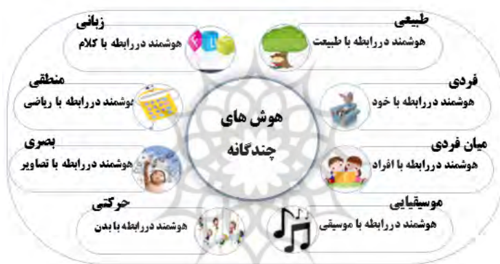
شکل ۱ هوش‌های چندگانه هوارد گاردنر (برگرفته از صدیق و همکاران، ۲۰۲۱)

(لطف آبادی، ۱۳۸۶؛ سیف، ۱۳۹۶). در دیدگاه سنتی، هوش ویژگی ذاتی افراد است و آموزش بر آن تأثیری ندارد (سیف، ۱۳۹۶). در مقابل، در تعاریف مدرن، هوش پدیده‌ای چند بعدی است که سطوح مختلف مغز، ذهن و سیستم بدن انسان را نشان می‌دهد (غریبی و همکاران، ۱۳۹۷؛ حاج هاشمی و همکاران، ۲۰۱۳) و باعث وجود روش‌های چندگانه و در عین حال منحصر به فرد در دریافت، پردازش و بازنمایی اطلاعات در موقعیت‌های مختلف برای افراد می‌شود (نوری، ۱۳۹۳). مهم‌ترین پیامد نظریه گاردنر؛ از نظریه پردازان معاصر، تک بعدی نبودن پدیده هوش است (مهرمحمدی، ۱۳۹۱). به باور وی، یک فرد دارای هوش‌های متفاوت یا نیمی‌رخ‌ی از بهره هوشی است که قابل تقویت هستند (گاردنر، ۱۹۸۳). این نیم‌رخ بهره هوشی را می‌توان به صورت شکل ۱ خلاصه کرد: