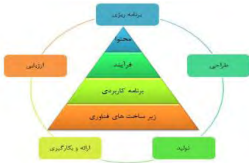
شکل ۱: مدل پیشنهادی آموزش الکترونیکی، منبع [۵]