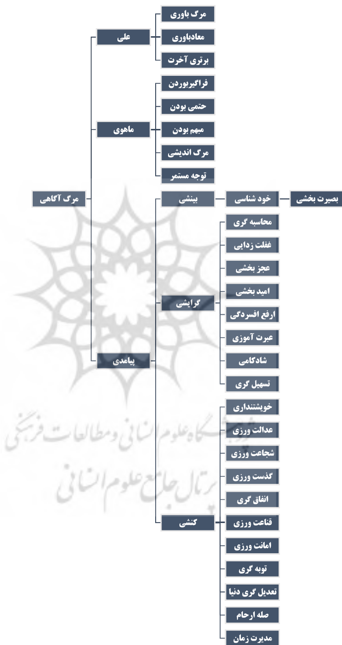
شکل ۲: الگوی مفهومی مرگ‌آگاهی در منابع اسلامی