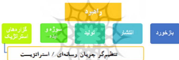
شکل ۱. مؤلفه‌های راهبرد فرایند جریان‌سازی

این مؤلفه گام دیگری از فرایند جریان‌سازی محسوب نمی‌شود؛ بلکه راهبردی است که در کنار گام‌های جریان‌سازی قرار می‌گیرد تا نواقص و ضعف‌های محتمل در طی این فرایند را پوشش دهد. تنظیم‌گر جریان رسانه‌ای بسته به برنامه، فرد یا گروهی است که راهبری محتوا را بر عهده دارد و از ابتدا تا انتهای فرایند جریان‌سازی حضور مؤثر دارد؛ با رفت و برگشت مستمر بین گام‌های مختلف جریان‌سازی باعث مراعات اصل پیوستگی در زنجیره جریان‌سازی از طراحی تا انتشار شود.