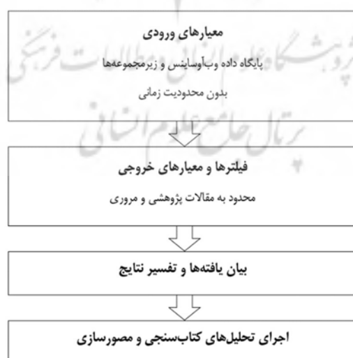
شکل ۱. گام‌های انجام پژوهش

برای بازیابی داده‌های مناسب جهت استفاده در فرآیند تحلیل، پایگاه وب‌آوساینس ۴ مورد استفاده قرار گرفت، چرا که در کنار پوشش جامع، مقالات و مجلات آن دارای کیفیت بالایی بوده و در مقالات مروری گذشته نیز مورد استفاده قرار گرفته است (Cuccurullo et al. 2016). پس از تنظیم کلیدواژه‌های مناسب جهت جستجو، ۷۱۲ عنوان پژوهش از پایگاه داده به دست آمد. به عنوان اولین فیلتر، نوع پژوهش‌های به دست آمده به مقالات پژوهشی و مروری محدود شد، چرا که این مقالات فرآیند داوری دقیق‌تری را پشت سر گذاشته‌اند. با اعمال این فیلتر ۶۱۶ مقاله در مجموعه باقی ماند. زبان مقالات دومین فیلتر تنظیم شده بود تا با محدود شدن به زبان انگلیسی، امکان تحلیل روند بین‌المللی پژوهش‌ها را فراهم سازد. با اعمال این فیلتر نیز ۵۵۵ مقاله در مجموعه خروجی باقی ماند. لازم به ذکر است هیچ نقطه آغاز و پایان زمانی برای بازیابی مقالات منتشر شده در نظر گرفته نشد تا همه‌ی پژوهش‌های مرتبط موجود در پایگاه وب‌آوساینس در بر گرفته شوند. سپس داده‌های کتاب‌سنجی جهت تحلیل وارد نرم‌افزار وی‌اواس و یوئر ۵ شدند. این نرم‌افزار که برای مصورسازی و نمایش الگوهای علمی مورد استفاده قرار می‌گیرد، شبکه گره‌ای را به صورت گرافیکی تصویرسازی می‌کند و با استفاده از خطوط پیوند که بیانگر رابطه و شدت است، گره‌ها را به یکدیگر متصل می‌کند (Donthu et al., 2020). شکل ۱ مراحل پژوهش انجام شده را نشان می‌دهد.