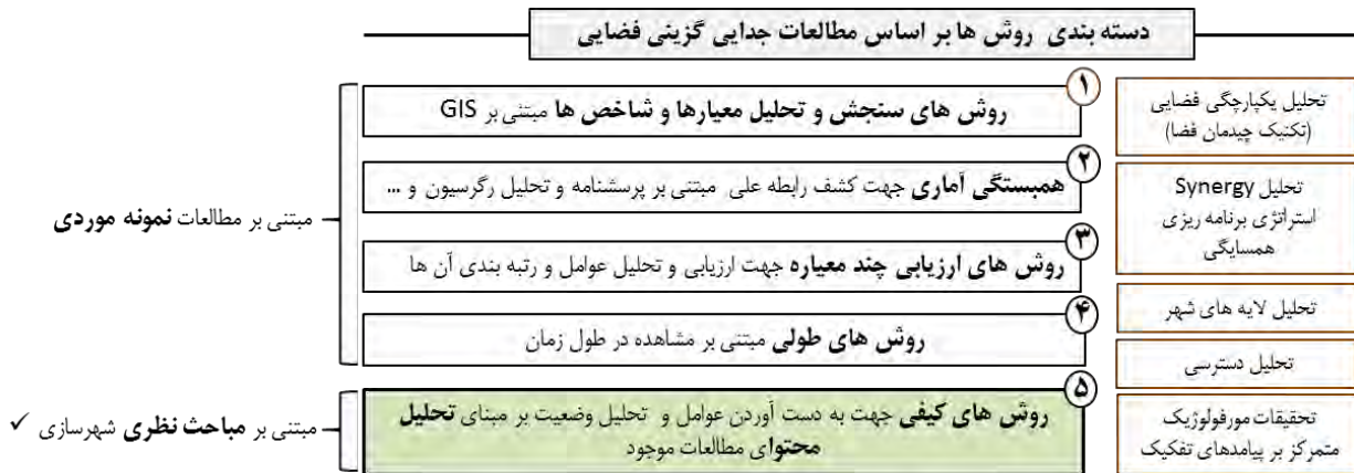
شکل ۱ دسته بندی روش ها بر اساس تحقیقات جدایی گزینی فضایی