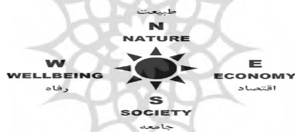
شکل ۱: ابعاد مختلف پایداری اجتماعی، پورطاهری و همکاران، ۱۳۹۲، (۷).

۱- اثر اکولوژیکی ۱ ، فشارسنج یا بارومتر پایداری ۲ ، انتخاب شاخص‌ها بر اساس آزمون و خطا ۳ ، چارچوب فشار- وضعیت موجود- واکنش ۴ ، رویکرد اندام‌وار یا نظام‌مند ۵ (سالمی و همکاران، ۱۳۹۰: ۶۰).