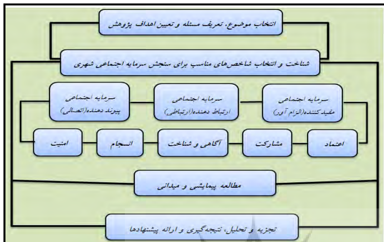
شکل (۱): مدل مفهومی مراحل انجام پژوهش

جمعیت توزیع و مجموعاً ۳۵۰ پرسشنامه تکمیل گردید. در نهایت تجزیه و تحلیل داده‌ها با استفاده از آزمون تی تک نمونه‌ای و تحلیل واریانس انجام گردیده است. سرانجام با توجه به این مطالب، ضمن سنجش و تحلیل شاخص‌های سرمایه اجتماعی شهری، در سطح شهر نسیم شهر، برای بهبود وضعیت، نسبت به ارائه راهکارهای مناسب، تلاش شده است.