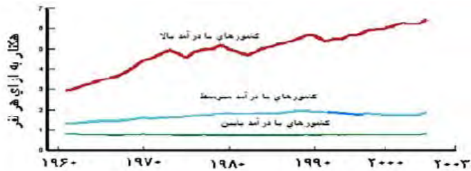
نمودار شماره ۱: ارتباط میزان درآمد کشورها با میزان رد پای اکولوژیکی