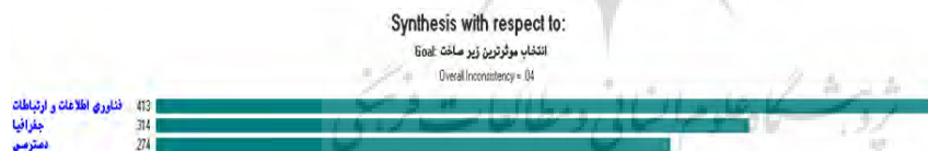
شکل ۹: انتخاب موثرترین زیرساخت در تغییرات ساختاری و فضایی و توسعه کالبدی، نگارندگان،

هر یک از این زیرساخت‌ها با قدرت بالا، توان ایجاد تغییرات در مقیاس خرد و کلان در سطح شهر را دارا می‌باشند؛ در نتیجه برای بدست آمدن نتیجه صحیح‌تر و دقیق‌تر اطلاعات را وارد نرم افزار Export choice و مدل AHP را طراحی و اجرا نموده‌ایم که خروجی آن در شکل (۹) دیده می‌شود.