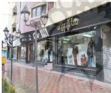
شکل ۵: نظم در خیابان هزار و یک شب

بجز در شکل شماره ۴ که ICT منجر به اغتشاش و برهم زدن فضای سه بعدی خیابان، خط آسمان را برهم میزند (که در مقوله سیمای شهری می‌گنجد. در تصاویر دیگر نشان از انتظام بخشیدن به فضای خیابان شده و تاثیر ICT را به وضوح نشان می‌دهد در شکل ۳ بیشتر عبور و مرور و ترافیک را ساماندهی نموده. در شکل ۵ شاهد تاثیر بر ویتترین مغاره‌ها، کوچک