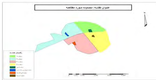
شکل ۱: محدوده مورد مطالعه، نگارندگان، ۱۳۹۲ (فقط محلات نشان داده شده و در راهنما نام محلات و مناطق)

محله شهر از محلات بسیار قدیمی شهر کرمان می‌باشد و بعد از محله شهر، محله صفاست که از قدمت بالایی برخوردار می‌باشد و دو محله دیگر جوان می‌باشند. مشخصات هر کدام از محلات در جدول زیر بیان شده است.