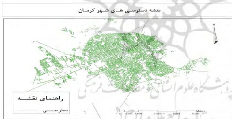
شکل ۱۱: نقشه دسترسی‌های شهر کرمان، نگارندگان، ۱۳۹۲

فرم و نظام شبکه‌بندی خیابان‌های شهر کرمان در مرکز شهر به‌صورت نامنظم و آشفته می‌باشد. سازمان فضایی شهر را می‌توان تمرکزگرا و تک‌هسته‌ای تشخیص داد که بازار و مسجد جامع، در قلب شهر واقع گشته‌اند و از این قلب تا محدوده بافت تاریخی به صورت نامنظم و آشفته و سپس به صورت یک شبکه شطرنجی نیمه‌منظم که سبب راحتی ارتباطات درون شهری شده است، استخوان‌بندی و ساختار شهر را تشکیل داده است (شکل ۱۱).