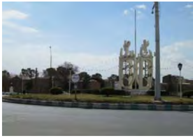
شکل ۷: میدان علی ابن ابی طالب