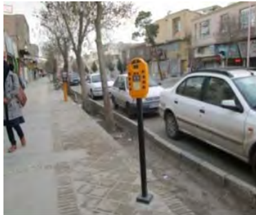
شکل ۳: تاثیر ICT بر نظم دهی خیابان