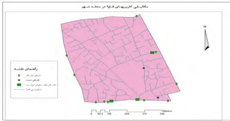
شکل ۸: نقشه مکانیابی کاربری‌های فاوا در محله شهر، نگارندگان، ۱۳۹۲