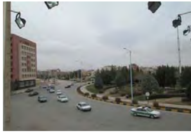
شکل ۶: میدان کوثر

میدان کوثر از میدادین بزرگ و جدید شهر محسوب می‌گردد که در ساخت آن به عملکرد اجتماعی میدان اهمیت داده شده است که از اثرات ICT می‌باشد (شکل ۶). میدان علی ابن ابی طالب از میدادین قدیمی و کوچک شهر می‌باشد که بیشتر شباهت به فلکه دارد تا میدان، چرا که بیشتر عملکرد گردش ماشین‌ها را ساماندهی می‌کند (شکل ۷).