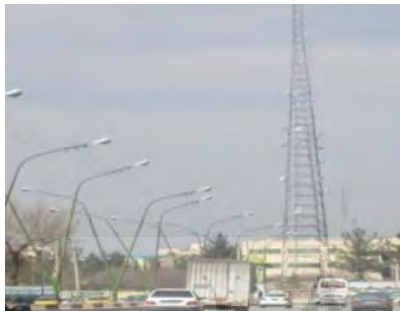
شکل ۴: ICT و اغتشاش در خیابان