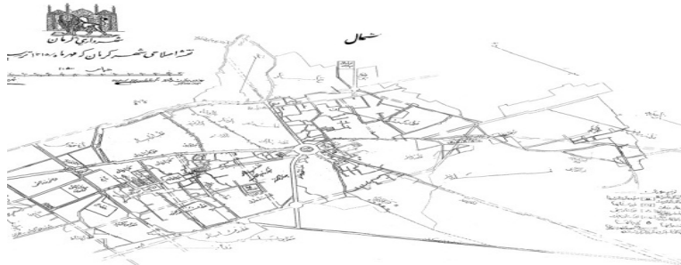
شکل ۱۰: نقشه کرمان در سال ۱۳۱۵، سازمان میراث فرهنگی، ۱۳۹۲

فناوری‌هایی مانند GIS و GPS برای توسعه شهر طرح‌هایی مناسب و درخور شهر و مردمان این شهر طراحی و اجرا می‌شود. زیرا این فناوری‌ها دارای قابلیت‌های بالا در به‌کارگیری معیارهای مختلف در کنار هم ایجاد طرح‌های مفید و قابل اجرا می‌باشند.