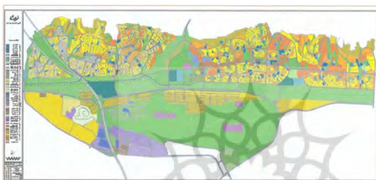
شکل ۲- کاربری اراضی شهر جدید صدرا