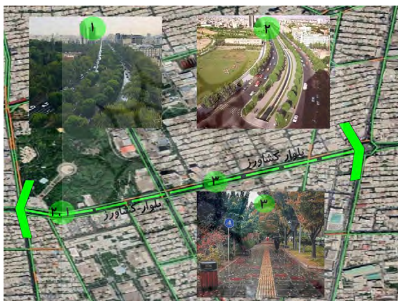
تصویر ۱. بلوار کشاورز حدفاصل میدان ولیعصر و خیابان کارگر

بلوار کشاورز یکی از مهم‌ترین خیابان‌های شهر تهران به حساب می‌آید. در این خیابان طی دوره‌های زمانی مختلف فعالیت‌های تفریحی، فرهنگی، اداری و تجاری بسیاری تمرکز یافته‌است. این بلوار در ابتدا با نام الیزابت نامیده می‌شد. احداث بلوار الیزابت در دهه ۳۰ و تکامل آن در دهه ۴۰، همزمان با این روند ساخت و سازهایی در اطراف محور بلوار شکل گرفت که هر کدام محرک‌های برای شکل‌گیری ماهیت آن بود. ساختمان‌های مسکونی سامان، هتل بلوار و سینما بلوار از عمده‌ترین نقاط اطراف این محور در این دو دهه بودند که وجود این نقاط به گونه‌ای این بلوار را تعریف می‌کند اما حضور کافه‌ها، رستوران‌ها، کباب‌ها و کازینوها که به سبک فرنگی در اطراف محور در این بلوار بین دهه ۳۰ تا ۵۰ به وجود آمده بودند و امروزه از خاطرات محو شده‌اند خود در تبدیل این محور به یک محور کاملاً تفریحی مؤثر بوده‌اند. با آغاز دهه ۵۰ و احداث پارک لاله و در ادامه آن احداث موزه هنرهای معاصر در مجاورت پارک، انرژی لازم به تمامی محور منتقل گردید. پس از انقلاب با توجه به وجود ساختمان وزارت کشاورزی در این بلوار، نام آن از بلوار الیزابت به بلوار کشاورز تغییر یافت. این بلوار امروزه به یکی از اصلی‌ترین فضاهای عمومی تهران تبدیل شده و همواره جمعیت زیادی در حال گذران اوقات فراغت خود در این بلوار می‌باشند.