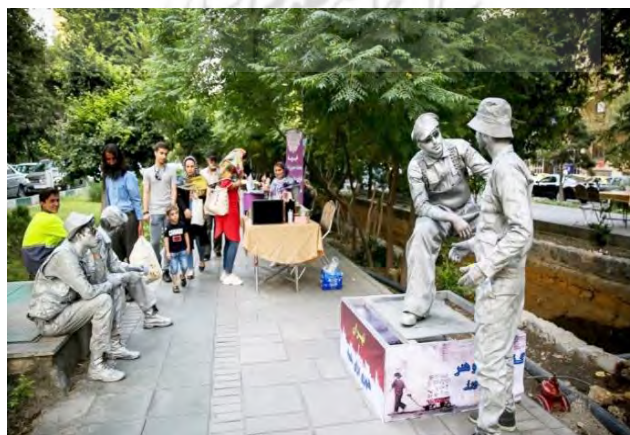
تصویر ۲. برگزاری مراسم فرهنگی در بلوار کشاورز