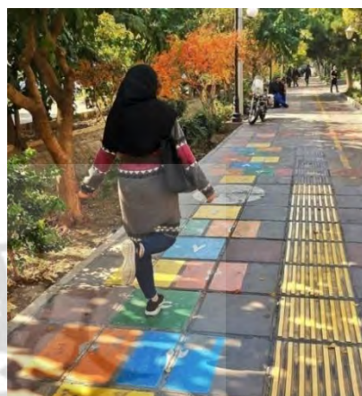
تصویر ۴. امکانات مناسب به منظور سرگرم شدن افراد در بلوار کشاورز