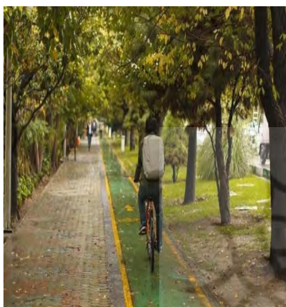
تصویر ۵. وجود مسیر دوچرخه‌سواری محافظت شده در بلوار کشاورز